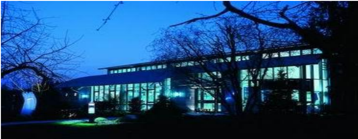
Ansicht Bürogebäude unseres Dienstleistungsunternehmens

Die plan.D GmbH ist ein Dienstleistungsunternehmen mit dem Ziel der ganzheitlichen Kundenbetreuung auf dem Gebiet der Gebäudetechnik. Im Jahr 2010 sind wir aus einem Ingenieurbüro für technische Gebäudeausrüstung als eigenständiges Unternehmen hervorgegangen. Unser Firmensitz befindet sich in einem modernen, gemeinschaftlich mit Danz FM genutzten Bürogebäude im nordhessischen Wabern in der Nähe von Kassel.