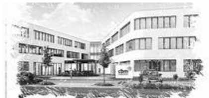
cbm in Bensheim

So soll die neue Zentrale der Christoffel-Blindenmission an der Stubenwald-Allee in Bensheim aussehen. Die Christoffel-Blindenmission (CBM) wird in Bensheim eine neue Zentrale bauen, die "innovativ und vor allem barrierefrei ist".