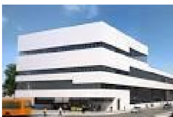
Porsche Ausbildungszentrum in Zuffenhausen

In Zuffenhausen entsteht das neue Ausbildungszentrum für die Auszubildenden der Porsche AG. Es soll ein hoch modernes, zukunfts-gerichtetes Aus- und Weiterbildungs-zentrum entstehen – für mehr als 500 Berufsanfänger.