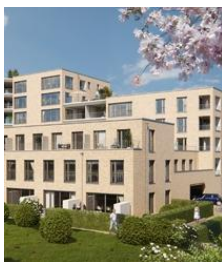
Theresiengärten in Hürth

In Hürth entsteht ein neues Wohn- und Geschäftshaus. Es entstehen 54 Wohneinheiten und Gewerbeflächen für den Einzelhandel, Außenanlagen, hauseigene Tiefgaragenstellplätze und Außenparkplätze für Besucher.