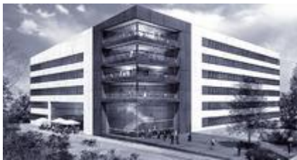
AIRPARK in Düsseldorf

In Düsseldorf entsteht ein neues Bürogebäude auf dem Airfield Gelände am Düsseldorfer Flughafen. Es entstehen knapp 12.000 m 2 Mietfläche, großzügiges Grundstück mit rund 6.000 m 2 , parkähnliche Außenanlagen, hauseigene Tiefgaragenstellplätze und Außenparkplätze für Besucher.