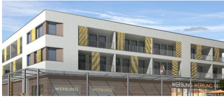
Alte Linde in Heusenstamm

In Heusenstamm entsteht ein neues Wohn- und Geschäftshaus. Es entstehen 64 Wohneinheiten und Gewerbeflächen für den Einzelhandel, Außenanlagen, hauseigene Tiefgaragenstellplätze und Außenparkplätze für Besucher.